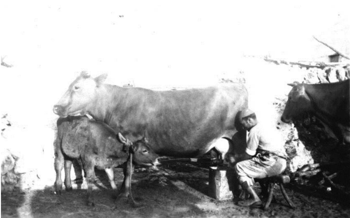
Foto antigua en la que se observa como la vaca Menorquina ya servía para producción láctea-quesera, a parte de su aprovechamiento cárnico.

Se acredita el arraigo social (tanto dentro del mundo agroganadero como fuera del mismo) e identificación cultural a través del gran poso histórico de convivencia con esta raza. El uso normalizado y conocimiento del término en la isla de “Vaca Menorquina” o “Vaca Vermella” es una prueba de ello. Estas implicaciones sociales y de identidad cultural representan un claro punto fuerte de la raza en cuestión.